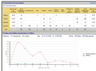
Bilan des mouvements